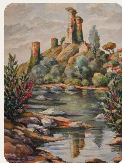
< Edouard Leverd, Ardèche 1933, Jaujac , aquarelle sur papier 48.5 x 32.5 cm

Aquarelles, gouaches, huiles, gravures, croquis, enluminures, illustrations : Edouard Leverd a expérimenté de multiples techniques, mais c'est surtout par l'aquarelle que s'exprima tout son talent artistique.