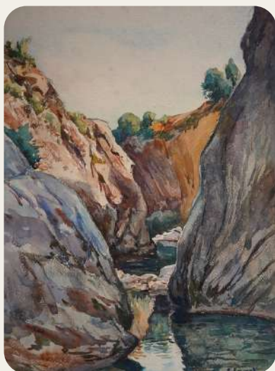
Edouard Leverd, Allier 1931, Hérissou, La forteresse vue depuis les rives de l'Allier , aquarelle sur papier 35 x 25 cm >

Le prêt remarquable d'une grande partie de la collection d'Edouard Leverd par ses descendants permet cette exposition atypique sur cet artiste hors pair méconnu du grand public.